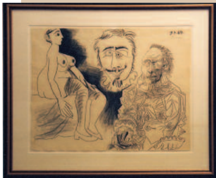
Tegning, datert 9. september 1969.

Denne utstillingen består av fire malerier, to skulpturer og ti tegninger. Arbeidene omfatter perioden fra 1905 og frem til 1970-årene, og viser en av 1900-tallets mest sentrale kunstnere. Utstillingen varer til 31. oktober, og prisene ligger på 1,8-2,4 millioner kroner.