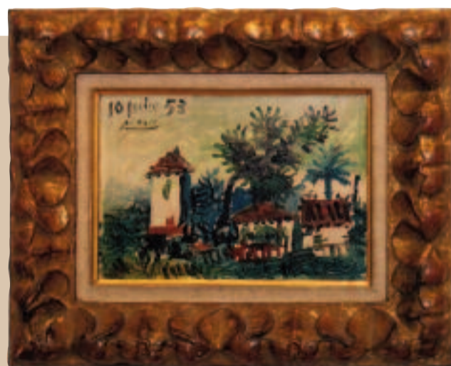
Olje på lerret, 10. juni '53

Picasso, klassisk marinemaleri, nonfigurativt: I minimalismens kjølvann skulle det være mange tomme vegger – og galleriene har mye spennende å by på.