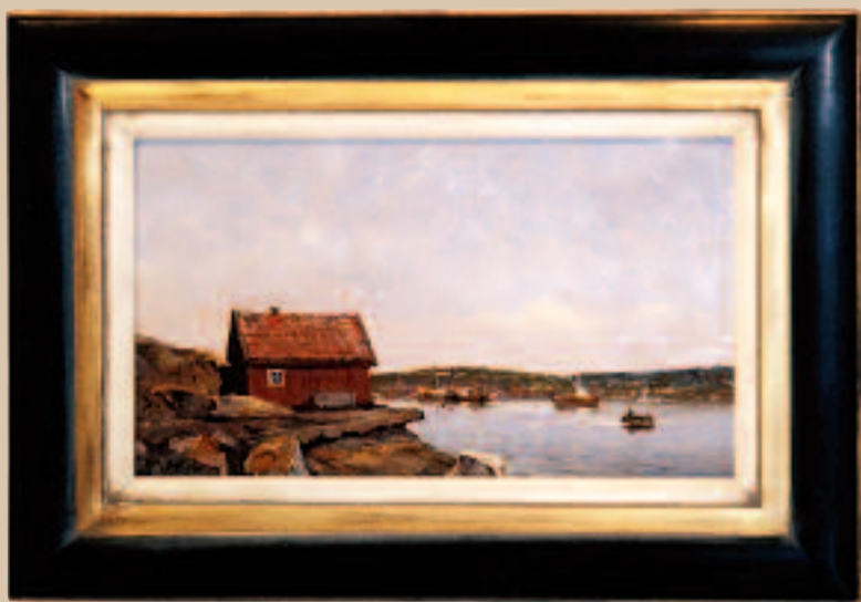
Fra Verdens Ende, Tjøme