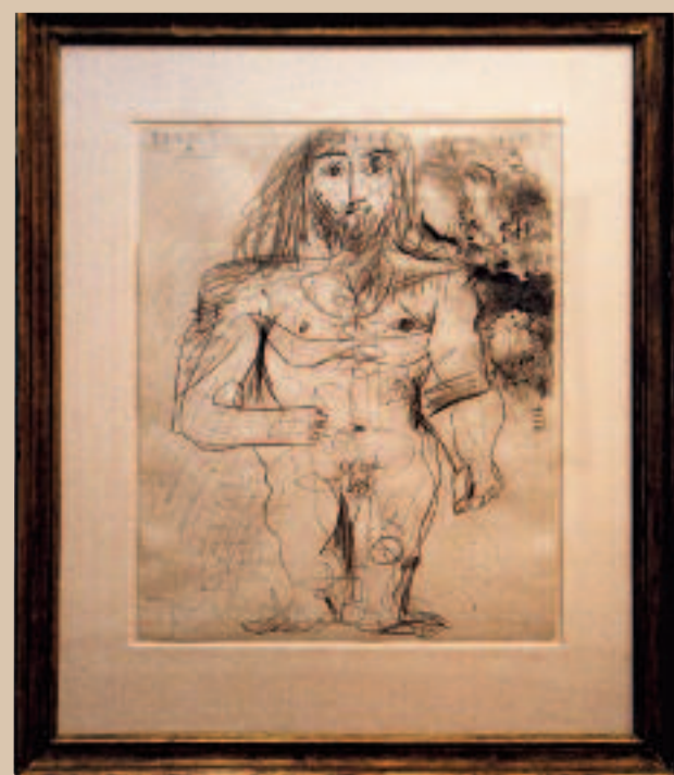
Tegning, datert 19. september 1966.