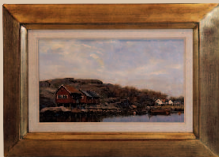
Fra Verdens Ende, Tjøme

Picasso, klassisk marinemaleri, nonfigurativt: I minimalismens kjølvann skulle det være mange tomme vegger – og galleriene har mye spennende å by på.